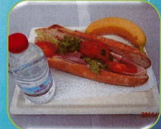
Sandwich jambon blanc