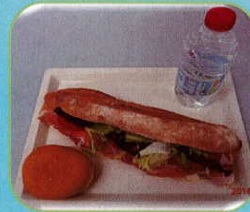
Sandwich jambon sec