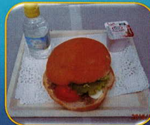
Pan pagnat thon