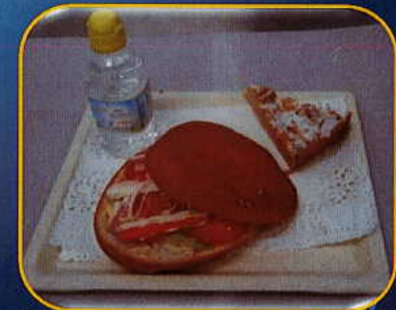
Pan pagnat surimi

Sandwich + petite bouteille eau plate ou aromatisée + dessert du jour = 3.46 €